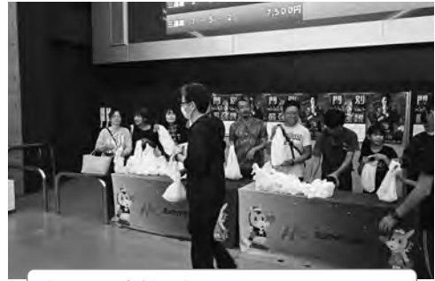
太陽の瞳特別 ミニトマトパック配布

ホッカイドウ競馬は馬産地日高にとって大変重要な産業となっております。今後とも応援よろしく申し上げます。