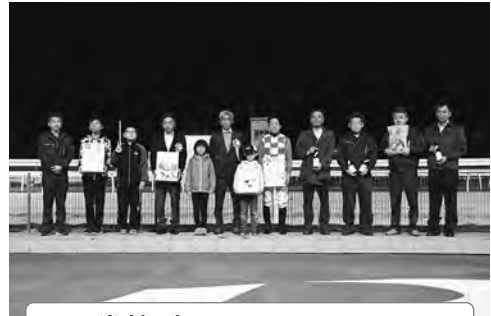
万馬券特別 子供プレゼンターと表彰式