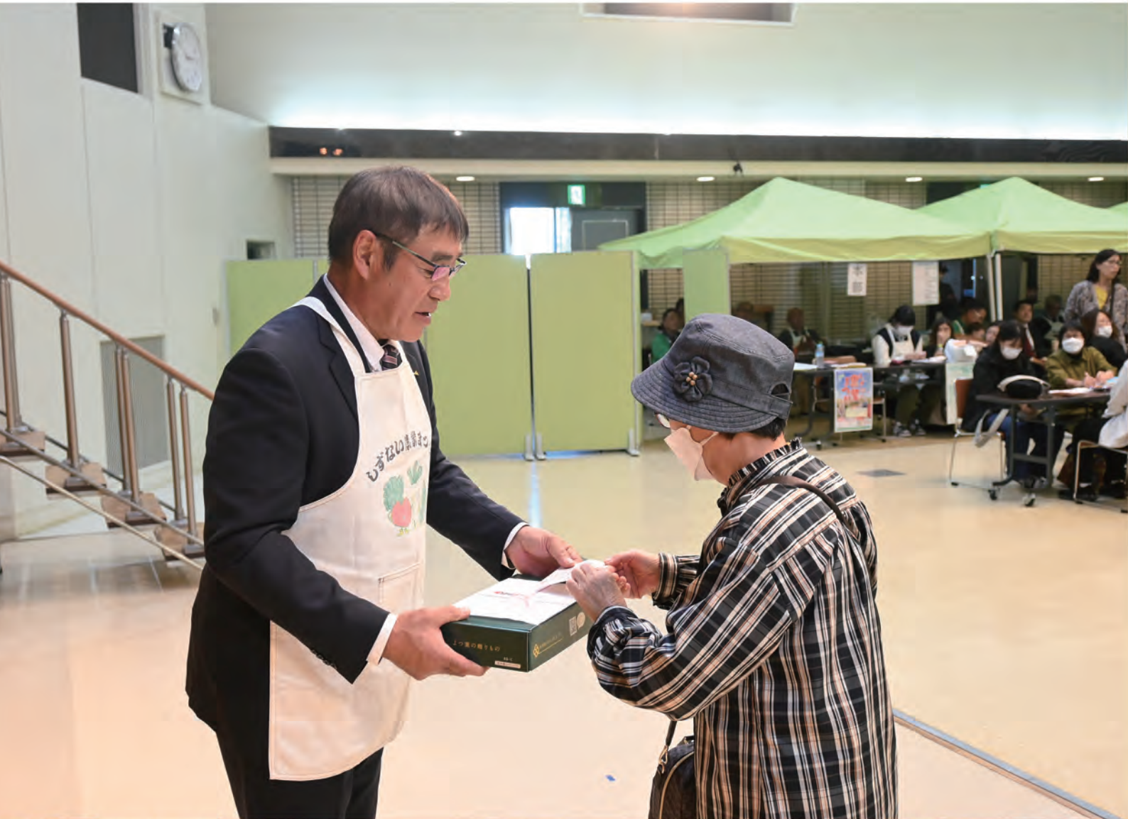
2024しずない農業まつり お楽しみ抽選会の風景