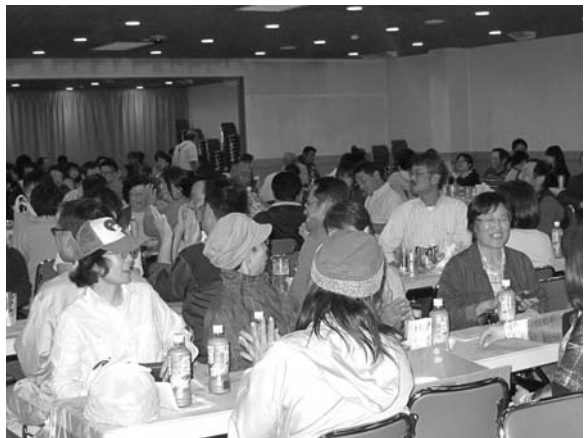
JAしずない女性部の方たちも大盛り上がりでした！

ホッカイドウ競馬は、馬産地である日高にとって、非常に重要な産業となっております。その産業を地元から盛り上げるべく、地域一丸となって支えたいきましょう。