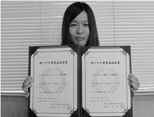
素晴らしい認証を頂きました！

認証制度が始まり、初めての認定となった今回は、町内17事業者から出品された35産品が認証される結果となりました。