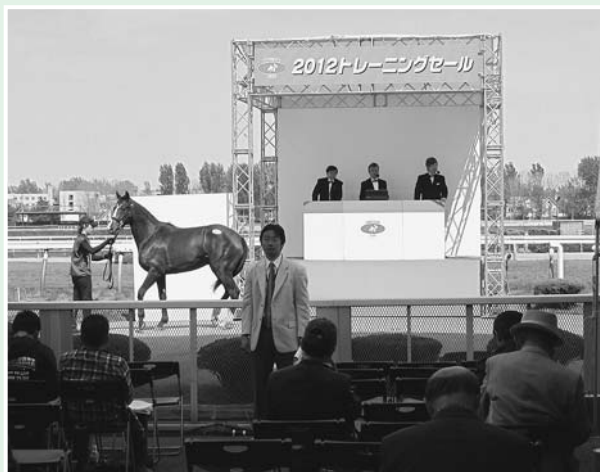
HBAトレーニングセール市場売却率

市場全体については、181頭(牡115牝66)が上場され、123頭(牡82牝41)が売却、売却率は68.0%(牡71.3% 牝62.1%)、売却総額については709,223千円(牡515,865千円 牝193,358千円)という結果となりました。