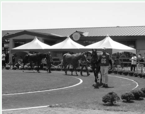
HBAセレクションセール市場売却率

売却率については、61.1%(牡67.1% 牝43.4%)となり、売却総額については、1,581,720千円(牡1,407,105千円 牝174,615千円)という結果となりました。